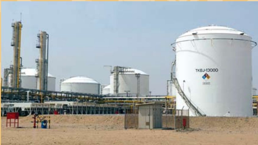
La SNI ha tenido enorme representatividad gremial en temas como el gas natural y las tarifas eléctricas.

Durante este período se han desarrollado campañas de defensa gremial en temas como Estado de derecho, libre mercado; energía en lo referido a gas natural y tarifas eléctricas, alimentos y negociaciones comerciales.