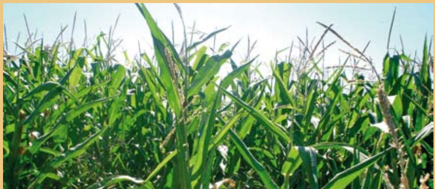
El tema de los transgénicos amerita un mayor análisis con propuestas técnicas.